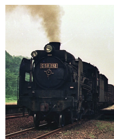
SLC58 212号機 (現在敦賀市本町にて展示)